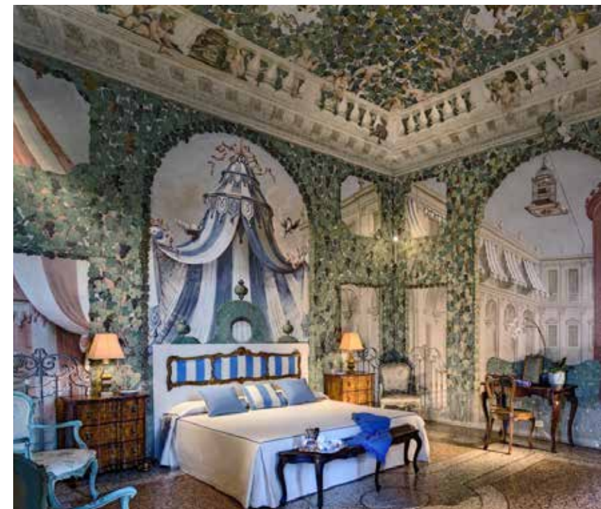
Una sontuosa camera da letto a Villa Emo Capodilista, detta La Montecchia, Selvazzano Dentro (Padova). Nella pagina accanto Villa Almerico Capra, detta "La Rotonda" del Palladio, Vicenza.