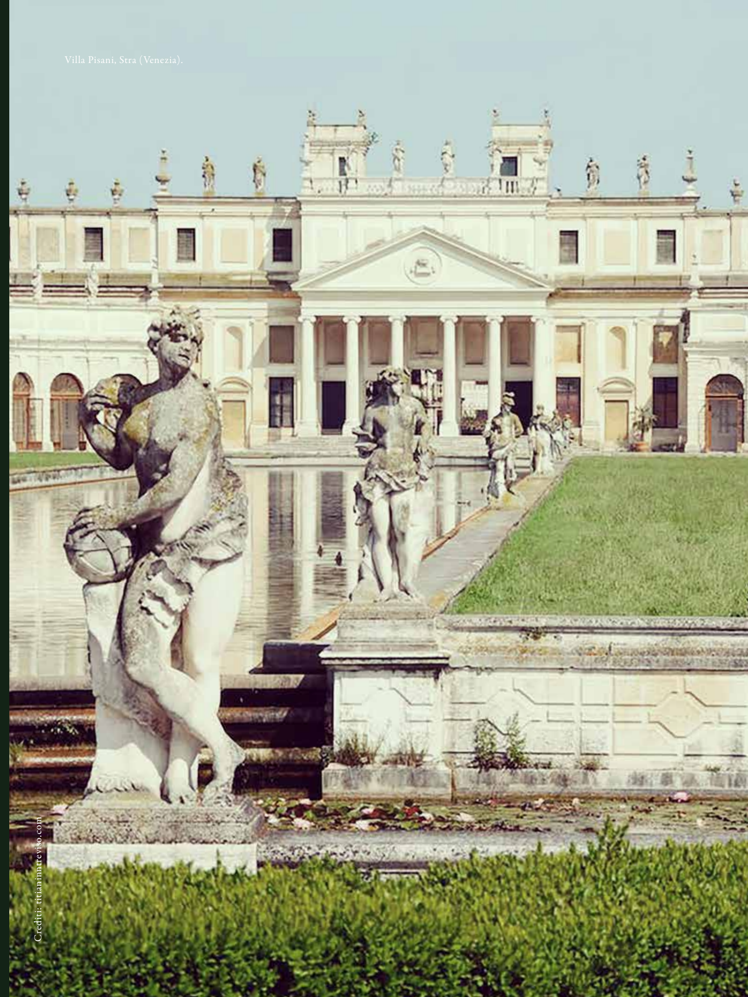
Villa Pisani, Stra (Venezia).

Le Ville Venete rappresentano uno dei più vasti, raffinati e ricchi giacimenti culturali del mondo: oltre 4.300 Ville Venete , sorte tra il XV e la fine del XVIII secolo, diedero vita alla “ Civiltà di Villa ” inaugurando una vera e propria rivoluzione culturale e politica guidata dalla Serenissima Repubblica di Venezia. Oggi le Ville Venete sono una tra le più alte espressioni del turismo culturale in Italia: le ritroviamo disseminate in pianura, adagate sui colli, specchiate lungo i fiumi, dalle sponde del Lago di Garda alle pendici del Carso, dalle Dolomiti all’Adriatico. Un patrimonio tutto da scoprire, chiamato anche “ Venezia in Terraferma ”. L’ Associazione Ville Venete , ente di riferimento dei proprietari, sindacato di tutte le Ville presso enti e istituzioni, dal 1979 è impegnata nella tutela e valorizzazione di questo patrimonio straordinario.