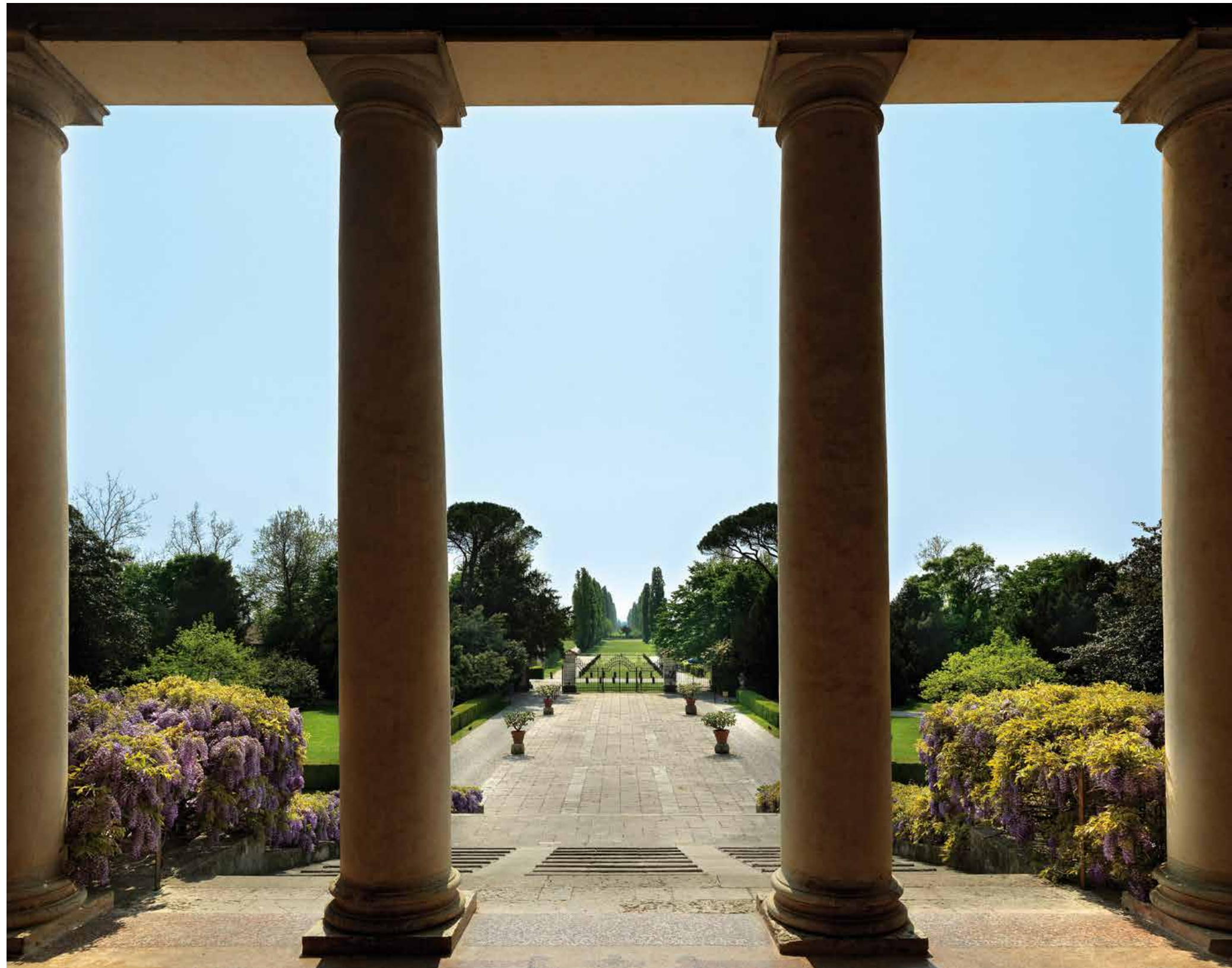
Vista dal "portego" di Villa Emo, Fanzolo (Treviso).

di parchi storici e giardini all'italiana e romantici